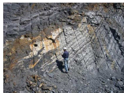
Fig. 1 Contacto de las ritmitas de magnesita con materiales pelíticos en la corta de Azcárate.

Los paquetes de magnesita (Fig. 1) son de tipo estratoligado y se sitúan preferentemente en la parte central de las dolomías, en paquetes de hasta 35 m, con una potencia acumulada máxima de 150 m (González-López y Arrese, 1977). Presentan texturas tipo cebrado o "ritmita", con una alternancia centimétrica de bandas oscuras y claras del mismo mineral, magnesita. Además en el interior de los paquetes se pueden encontrar niveles pelíticos de potencia centimétrica-decimétrica.