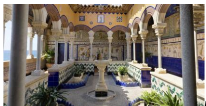
Fig. 1. Vista general del claustro superior de Maricel de Terra.

El millonario norteamericano Charles Deering (1852-1927) compro en 1910 al Ayuntamiento de Sitges el antiguo Hospital de San Juan, fundado en el año 1326 por Bernat de Fonollar, el cual fue transformado por el arquitecto y artista Miguel Utrillo (1862-1934) en el Palacio Maricel de Mar, donde el magnate estableció su residencia. En la terraza se construyó con elementos procedentes de edificios religiosos y civiles, un pequeño claustro con galería al exterior (Fig. 1).