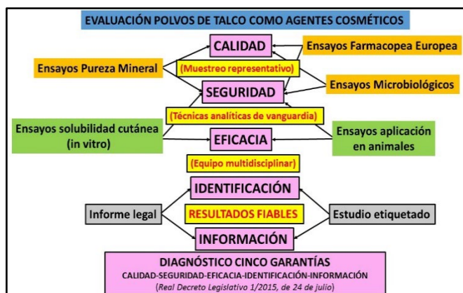
Fig 1. Planteamiento metodológico/conceptual global del proyecto de investigación Evaltalc B-CTS-20-UGR20.

microscopio electrónico de barrido (SEM) con microanálisis (EDX), b) análisis de imagen (IA), con especial énfasis en la evaluación de su carácter fibroso.