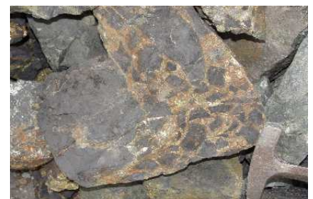
fig 2. Fotografía de los cuerpos de brecha, con fragmentos de magnetita masiva, cementado con piritita-pirrotita.

continuidad longitudinal discreta en dirección NW 45° SE y buzamientos cercanos a la vertical.