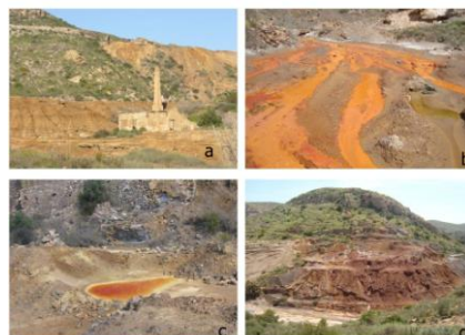
fig 1. Zona de estudio

Como resultado de la intensa actividad extractiva llevada a cabo en la zona, se han cuantificado numerosos focos de contaminación (García-Lorenzo et al., 2009) por metales pesados, cuyo transporte se ve favorecido por las aguas de escorrentía (Figura 1). Este proceso de movilización de metales pesados como consecuencia de la disolución oxidativa de sulfuros ha culminado en la redistribución de estos materiales en distintas formas químicas entre las fases sólida y líquida (Navarro et al., 2012; Lottermosser, 2007).