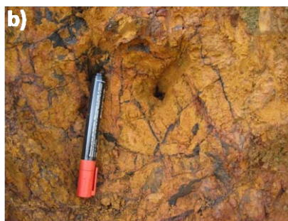
fig 1. Detalle de afloramientos de la mineralización de oxihidróxidos de Mn ricos en Co.