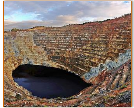
Corta Atalaya (Minas de Río Tinto, Huelva, España). Yacimiento de sulfuros masivos vulcanogénicos.